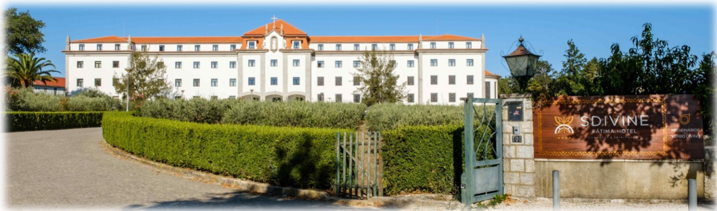
SDivine Fátima Hotel

Rotunda dos Peregrinos 101, 2495-412 Fátima, Portugal